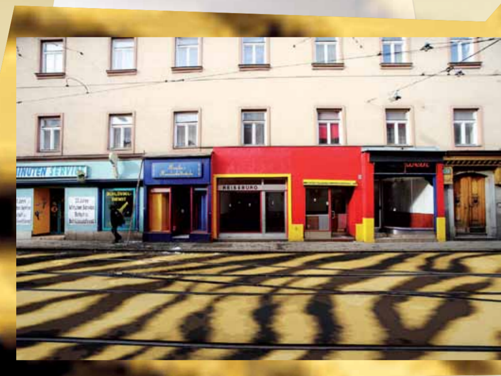
← GIRAFFE* *Girafa camelopardalis Säugetier